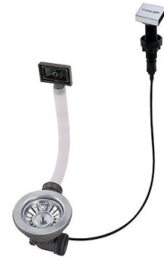
Desagüe automático LIRA 8407 102