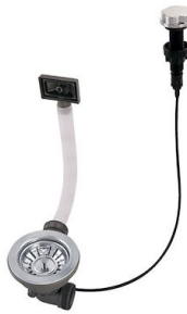
Desagüe automático 8407 000